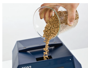
1. Засыпать образец