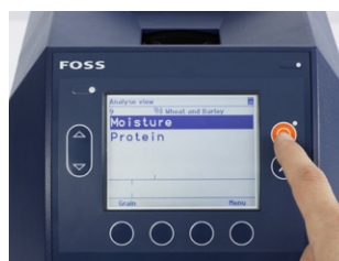
3. Нажать кнопку запуска