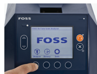
2. Выбрать тип зерна